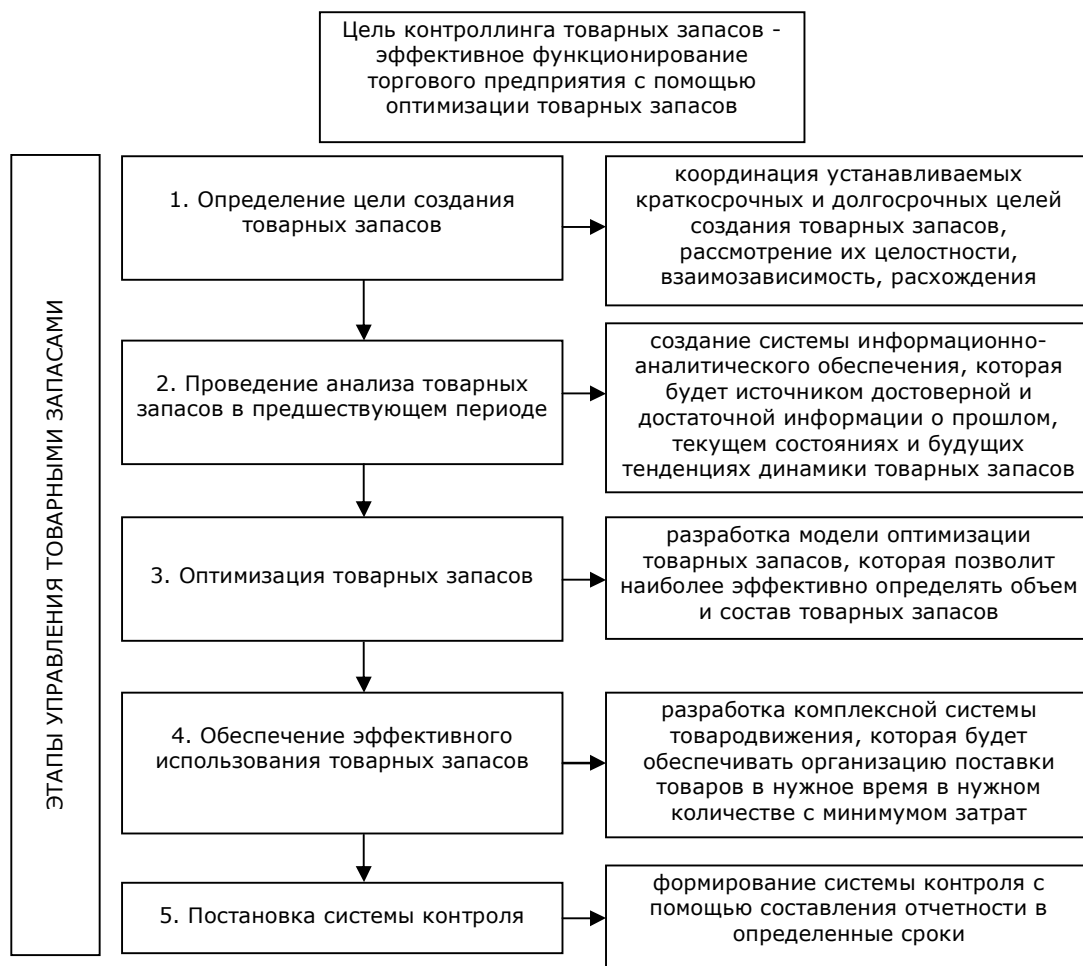
Рис. 3. Модель контроллинга товарных запасов

Автором статьи была сделана попытка определить теоретические аспекты контроллинга товарных запасов, на основании которых построена его модель, т.к. в настоящее время практически отсутствует теоретическая база в данной области исследования.