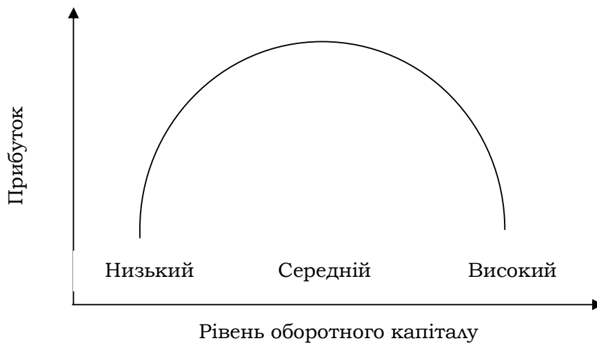
Рис. 1. Взаємозв'язок прибутку та рівня оборотного капіталу [11, с. 53-54]

Ризик втрати ліквідності або зниження ефективності, обумовлений обсягом та структурою оборотного капіталу потенційно несе у собі такі елементи: