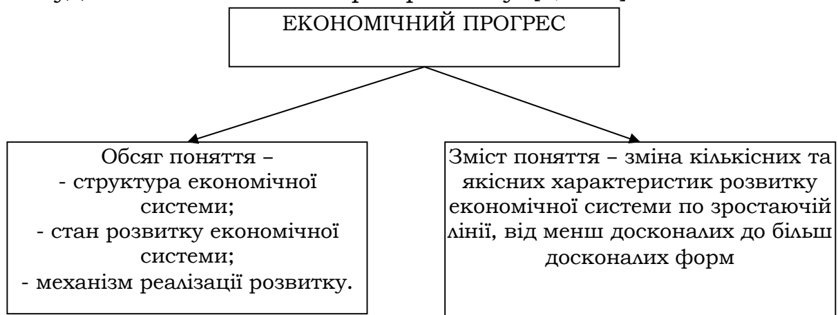
Рис. 3. Основні структурні елементи поняття «економічний прогрес»

правовий, культурний, духовний тощо. Зокрема, російські економісти А.В.Бузгалін та А.І.Колгонов розглядають економічний прогрес «...як історично існуючу...основу суспільного прогресу, при цьому постійно акцентуючи увагу на тому, що люди та їх об'єднання самі створюють свою історію за об'єктивними законами, що економічно ніколи не було єдиним, а в перспективі і не буде головним каталізатором розвитку» [8, с.81].