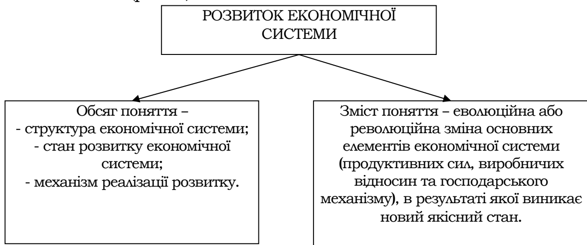
Рис. 1. Основні структурні елементи поняття «розвиток економічної системи»

Кожній стадії розвитку економічної системи відповідає певна структура (структура економічної системи), стан (кількісні та якісні характеристики) та механізм реалізації розвитку, які і формують обсяг поняття (рис. 1).