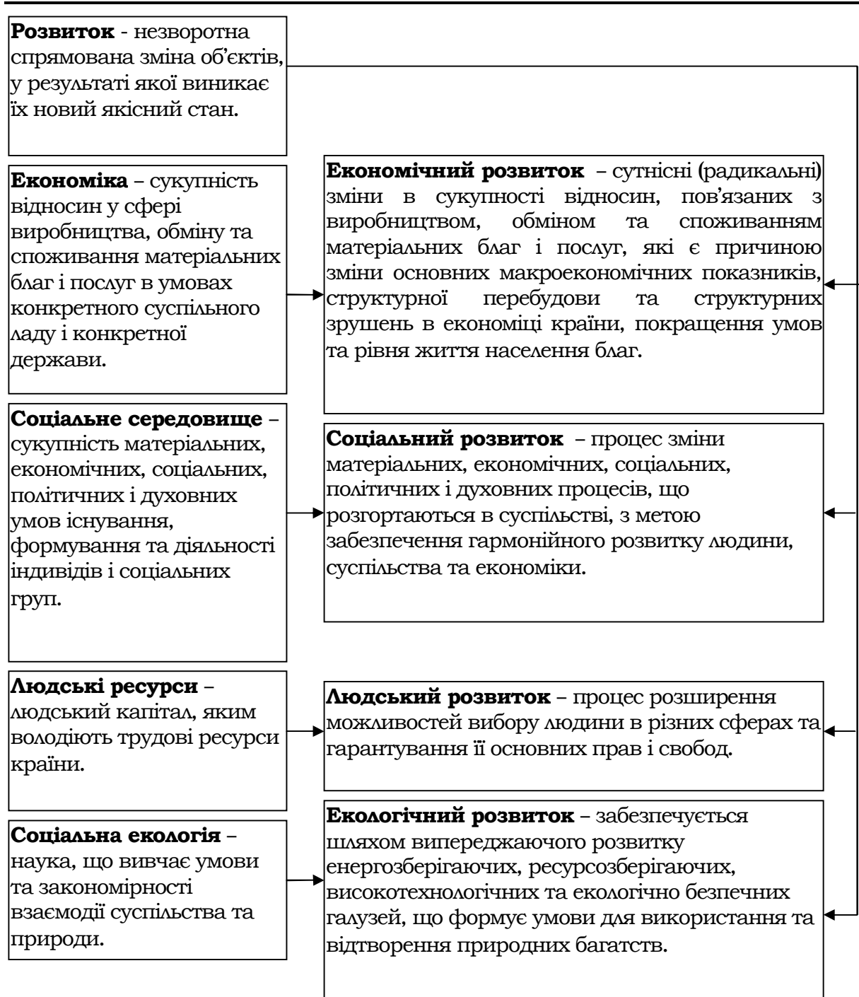
Рис. 2. Основні елементи, які формують розвиток економічної системи

Поняття «прогрес» походить від латинського слова progressive , що означає «...рух вперед, поступальний розвиток суспільства по зростаючій лінії, від менш досконалих до більш досконалих форм» [4, с.49]. З економічної точки зору прогрес передбачає поступальний розвиток основних елементів економічної системи (рис. 3).