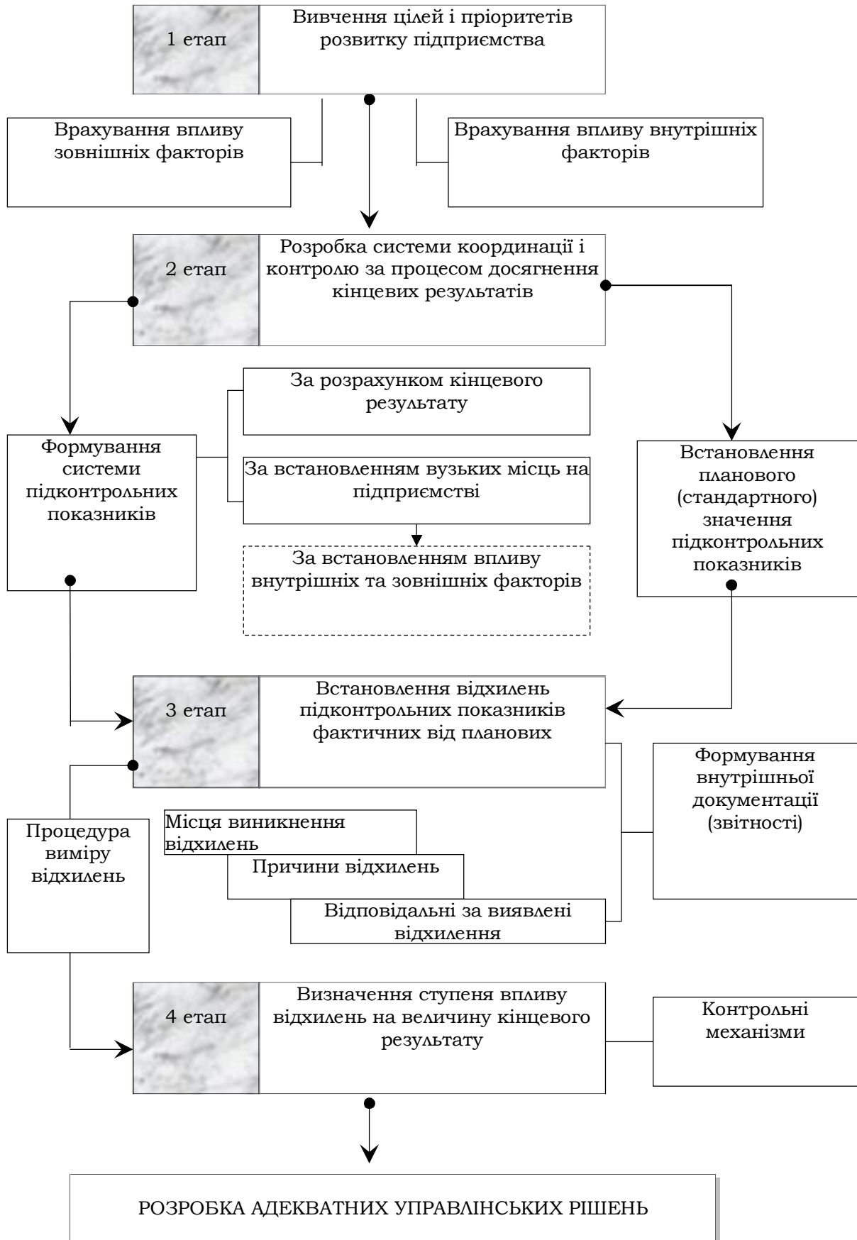
Рис. 1. Послідовність процесу організації та впровадження системи внутрішнього контролю