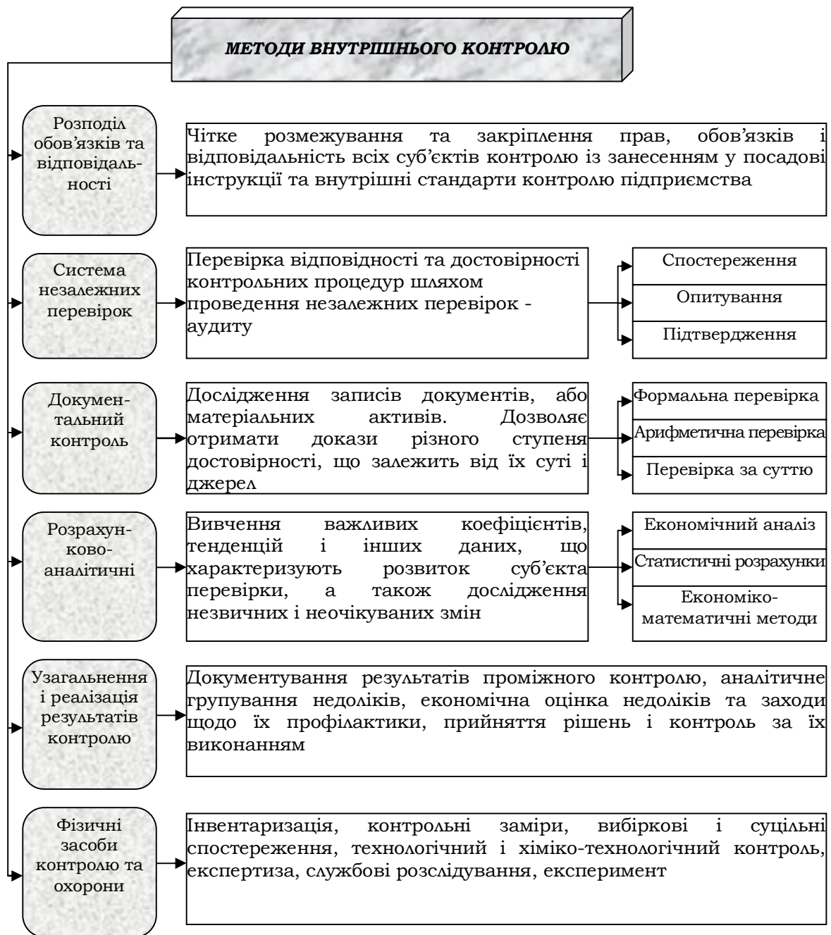
Рис. 2. Методи внутрішнього контролю

На нашу думку, перелік цих факторів слід доповнити такими, як: обсяг, складність та специфіка видів діяльності підприємства, особливості контрольного середовища і системи бухгалтерського обліку. Дані методи контролю можна деталізувати за допомогою великої кількості процедур контролю.