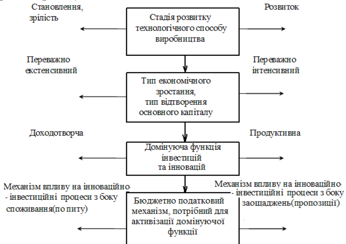
Рис. 2. Логіка формування механізму БПП: еволюційний підхід

стимулювання якої і повинні спрямовуватися регулюючі зусилля держави. Відповідно з можливостями виконання цього завдання і обирається фінансовий механізм впливу на інвестиційні процеси (рис. 2).