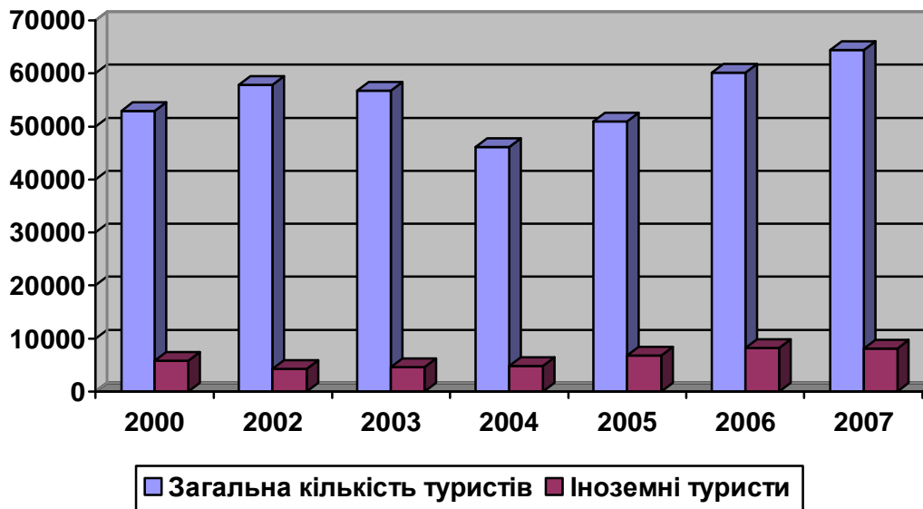
Рис. 1. Динаміка зростання обсягу туристів, які перебували у Чернівецькій області (2000-2007 рр.) [1]

Здається, що вказані цифри повинні говорити про те, що готельне господарство області позитивно впливає на залучення іноземних гостей. Однак насправді порівняння можливостей готельного господарства області з показниками обслуговування іноземних туристів говорить про зворотну ситуацію (табл. 3).