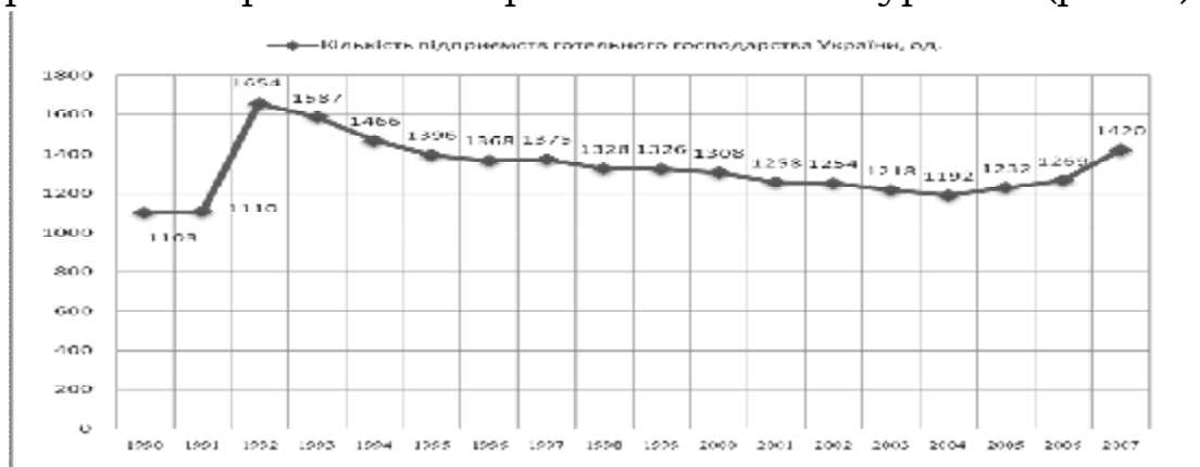
Рис. 1. Динаміка кількості підприємств готельного господарства України за 1990 – 2007 рр. [9]

Результати аналізу тенденцій зміни кількості підприємств готельного господарства України за 1990-2007 роки засвідчили, що динаміка кількості підприємств гостинності, починаючи з 1990 по 1992 рік, мала стрімку тенденцію до зростання. Зокрема, в 1992 році їх кількість зросла на 544 одиниці, або на 49,01%, порівняно з попереднім 1991 роком. Таке збільшення кількості підприємств сфери гостинності було зумовлене в основному зростанням загального інтересу до України зі сторони інвесторів та іноземних туристів (рис. 1).