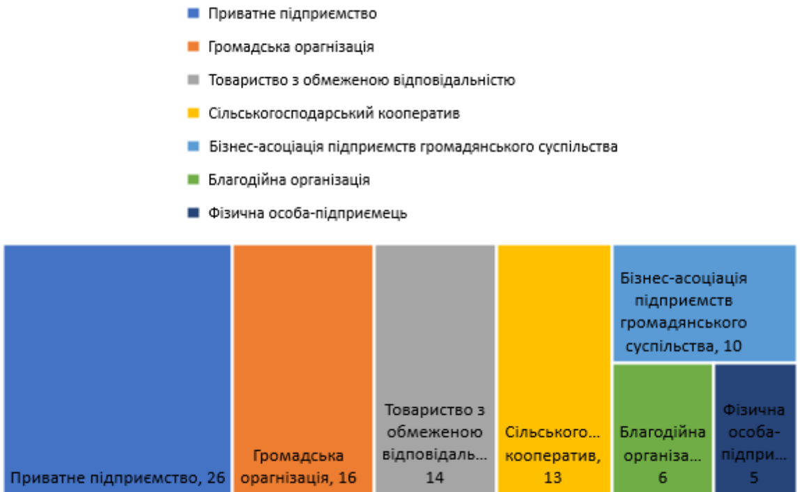
Рис. 2. Форма власності соціального підприємництва, % [9]