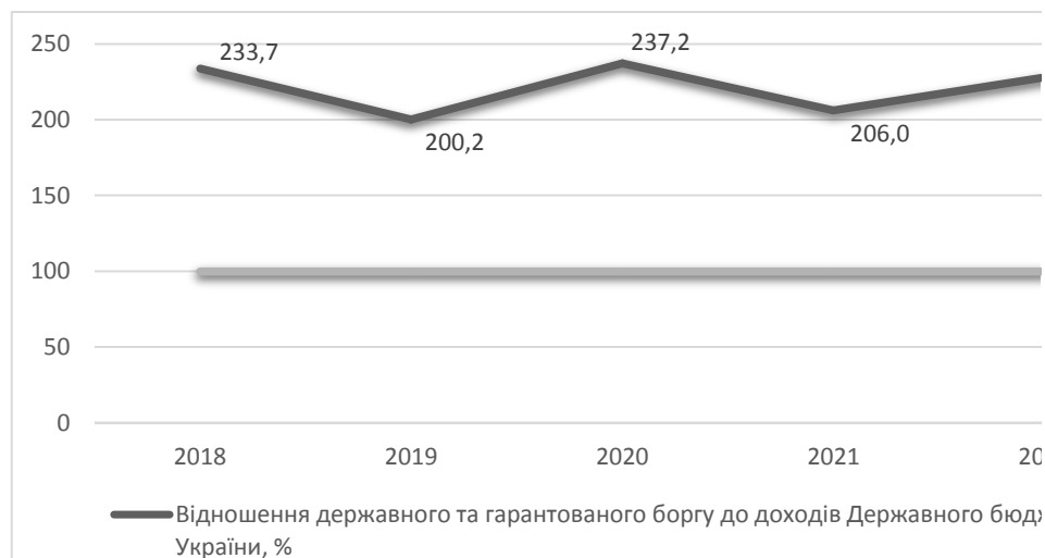
Рис. 1. Співвідношення сукупного державного боргу та доходів Державного бюджету України за 2018–2022 рр., %

Україні. Тому важливо розглянути спочатку виконання Державного бюджету України та причини, які вплинули на його недовиконання.