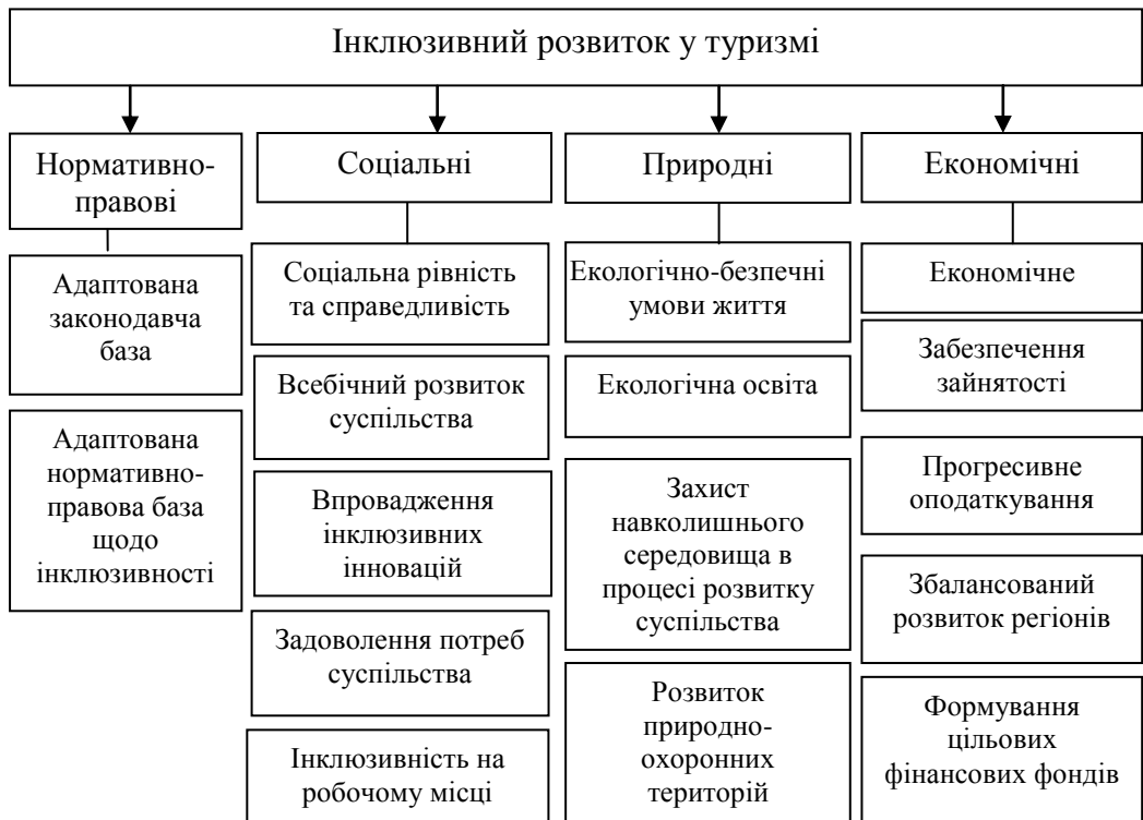
Рис. 2. Орієнтири впровадження моделі інклюзивного розвитку в туризмі*

насамперед регулювало діяльність підприємств та гарантувало інклюзивність для всіх сторін.