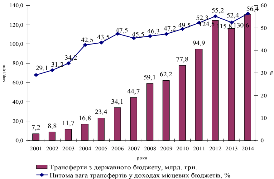
Рис. 2. Динаміка трансфертів, наданих з державного бюджету місцевим бюджетам у 2001-2014 роках*

Водночас міжбюджетні трансферти, що передаються з державного бюджету, виступають стабільним джерелом наповнення місцевих бюджетів. Їх динаміка та частка у загальному обсязі доходів місцевих бюджетів України за 2001-2014 роки відображена на рис. 2.