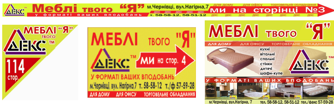
Рис. 3. Макети рекламних оголошень виробника меблів ТМ «ДЕКС» для розміщення у ділових виданнях Буковини*

Реклама у ділових виданнях Буковини. Ділові видання є обов'язковим місцем розміщення реклами. Коли споживач шукає певний товар чи фірму, він обов'язково звертатиметься до рекламно-інформаційних видань. Інші носії забезпечать впізнаваність, а більш повну інформацію споживач отримає саме з друкованого видання. Більшість рекламодавців прагнуть потрапити на титульні та останню сторінки обкладинки журналу, й це правильно, оскільки імовірність контакту із споживачем тут найвища.