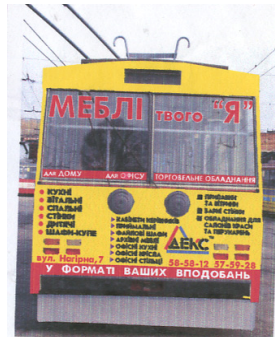
Рис. 1. Розміщення реклами виробника меблів ТМ «ДЕКС» на різних бортах тролейбуса*