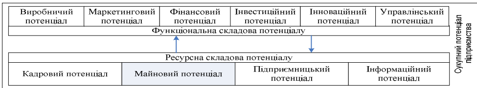
Рис. 1. Місце майнового потенціалу у структурі потенціалу підприємства*

Проведене дослідження щодо визначення структури потенціалу підприємства дає змогу визначити основні типи сукупного потенціалу підприємства та місце в ньому майнового потенціалу (рис. 1).