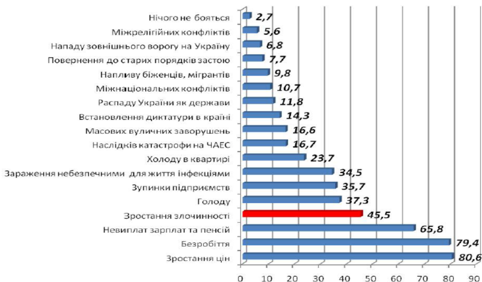
Рис. 2. Найбільш поширені страхи в громадській думці громадян України у 2012 році, %* *Джерело: [7, с. 5]

Злочинність – провідна соціальна проблема, яка хвилює всі верстви населення: управлінську еліту, представників бізнесових структур, приватних підприємців, сільських жителів та міських громадян, про що свідчать результати соціологічних опитувань. Зокрема, за даними опитування, проведеного Інститутом соціології НАН України у 2012 році (рис. 2), серед найбільших проблем, що непокоять жителів України, поряд зі зростанням цін (80,6% опитаних), безробіттям (79,4%), невиплатою зарплат та пенсій (65,8%), стоїть проблема злочинності (45,5%, 4-те місце в рейтингу) [7].