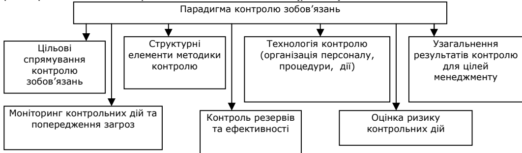
Рис. 2. Парадигма контролю зобов'язань

Виходячи із названих засад, парадигму контролю зобов'язань підприємств ресторанного господарства можна подати так (рис. 2):