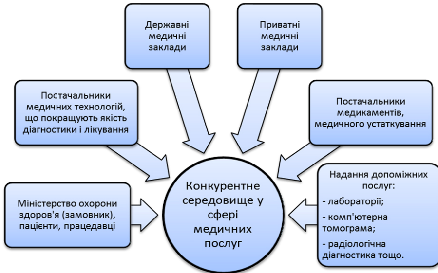
Рис. 2. Вплив чинників на конкурентне середовище медичної сфери [5, с.39]

Наведені на рис. 2 чинники мають сприяти формуванню та підсиленню конкурентного середовища, проте в існуючих реаліях призводять до збільшення видатків у медичній сфері. Головні причини криються у постачальниках медичних технологій, лікарських засобів та інших провайдерах. За існуючою схемою викривляється система стимулювання, що дозволяє зазначеним силам збільшувати власні статки, незважаючи на збільшення кривої затрат [3].