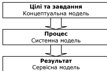
Рис. 1. Креативна модель виконання завдання*

Креативна модель – структура знань предметної галузі, яка включає навігаційну структуру (рис. 1). Остання зазвичай виконує функції візуалізації алгоритмів, що стосуються реакції на виклики зовнішнього середовища, розв'язання внутрішніх проблем системи, підготовки та надання в зовнішній простір системи інформації (меседжів) щодо поточного стану, цілей і стратегії її розвитку.