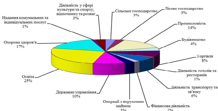
Рис. 2. Зайнятість населення за видами економічної діяльності в Чернівецькій області станом на 01.01.2011 р. [9, с. 42]

Аналіз структури ринку праці Чернівецької області (рис. 2 показує, що велика кількість зайнятого населення припадає на дотичні до туризму сфери діяльності.