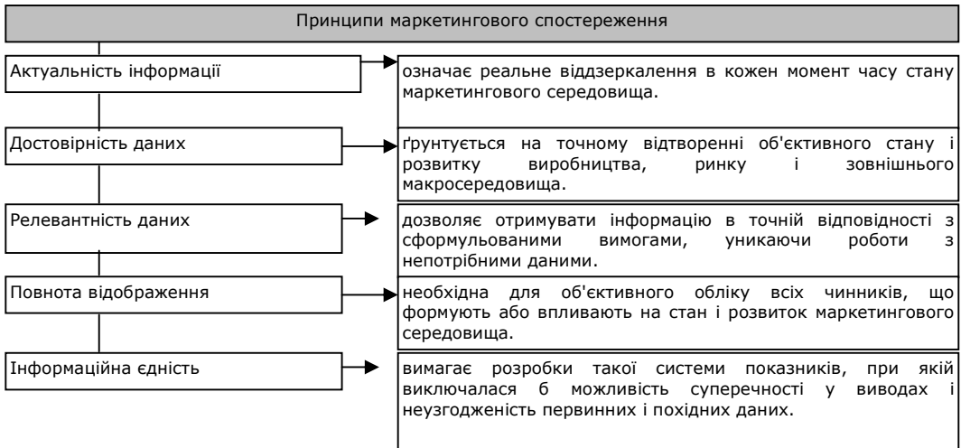
Рис. 2. Принципи маркетингового спостереження

У процесі маркетингового спостереження необхідно дотримуватися наступних принципів: актуальність інформації, достовірність даних, релевантність даних, повнота відображення, інформаційна єдність (рис. 2).