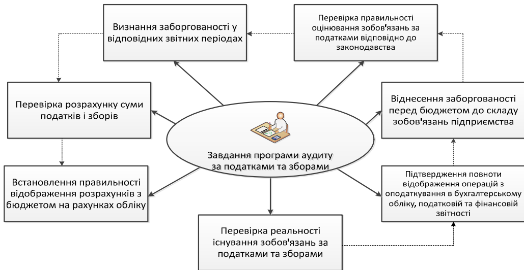
Рис. 2. Завдання аудитора (сформовано автором на підставі [3, с.102])