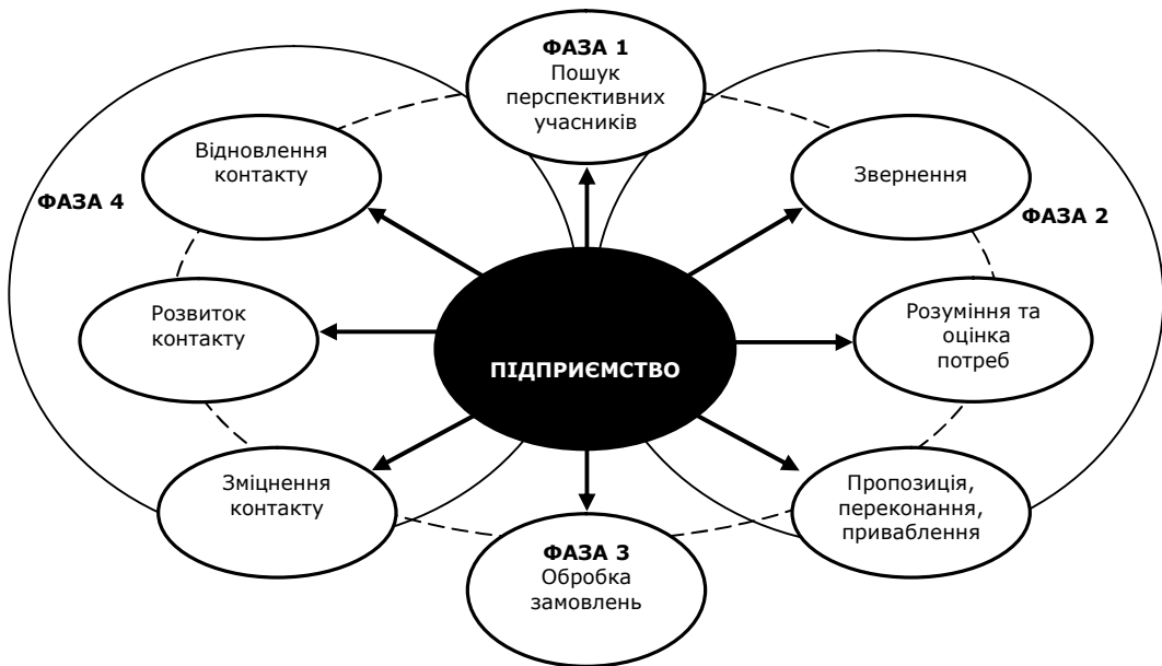
Рис. 2. Модель організації роботи з перспективними учасниками розповсюдження

Збільшити кількість відкликів на пропозиції про співпрацю можна також здійснюючи контроль якості перспективних контактів з потенційними партнерами. Для цього необхідно розподіляти потенційних учасників розповсюдження по категоріях у відповідності до чітко встановлених правил. У такому випадку процес налагодження співпраці набуває вигляду послідовності рішень "Продовжити-припинити".