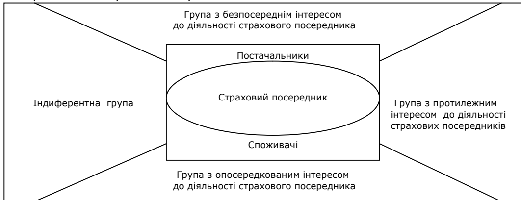
Рис. 2. Групи клієнтів у конкурентному бізнес-середовищі страхових посередників

Схематично групи клієнтів у конкурентному бізнес-середовищі страхових посередників зображено на рис. 2.