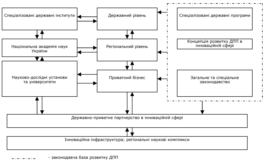
Рис. 1. Загальна модель співпраці держави і бізнесу в інноваційній сфері

Управління формуванням, функціонуванням та розвитком науково-технічної сфери повинна здійснювати регіональна влада, використовуючи штатні (економічний відділ) і створюючи нові підрозділи, такі як консультативно-дорадчі ради, комісії з питань науково-технічного прогресу. Основними завданнями такої ради (комісії) може бути розгляд науково-технічних прогнозів, визначення пріоритетів науково-технічної діяльності, проектне фінансування сумісних програм держави і бізнесу, рекомендації з розвитку механізму державно-приватного партнерства [6].