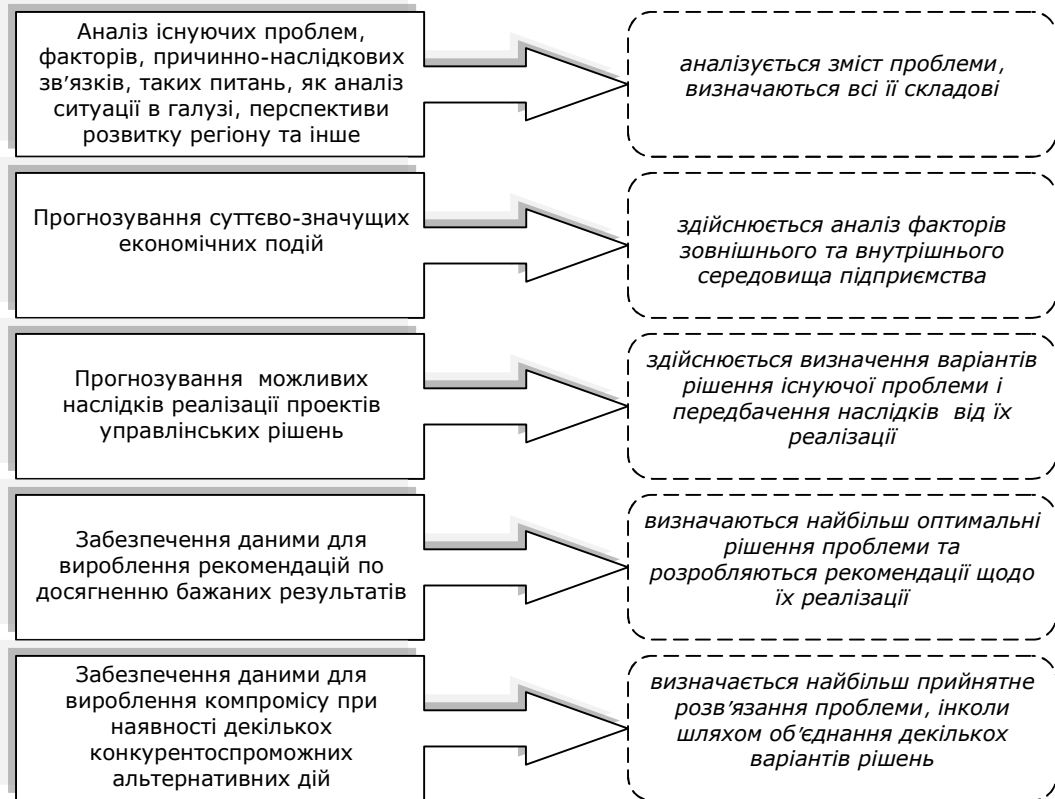
Рис. 1. Завдання сучасного обліку в інформаційному забезпеченні управління підприємством

Найбільш важливого значення в інформаційному забезпеченні набуває сама інформація як ресурс, вмiле використання якого підвищує конкурентоспроможність підприємства на ринку в цілому і його цінність для конкретного споживача. Даючи оцінку розвитку сучасної економічної науки, М.Довбенко констатує: «Цивілізаційний поступ характеризує не лише глобалізація, а й дезінтеграція. Настає технотронна ера, в якій формується нова економіка – економіка динамічних знань з її найзатребуванішим товаром – інформацією» [2, с.5]. Недооцінка інформації як економічного ресурсу веде за собою відставання та зниження конкурентоспроможності, а в результаті і втрату споживачів, зниження вартості підприємства на ринку і, врешті, втрату бізнесу. Отже, в сучасному світі ступiнь розвитку суспільства визначається швидкістю обміну інформацією, темпом циркуляції ідей. Не володіти інформацією означає бути виключеним з майбутнього.