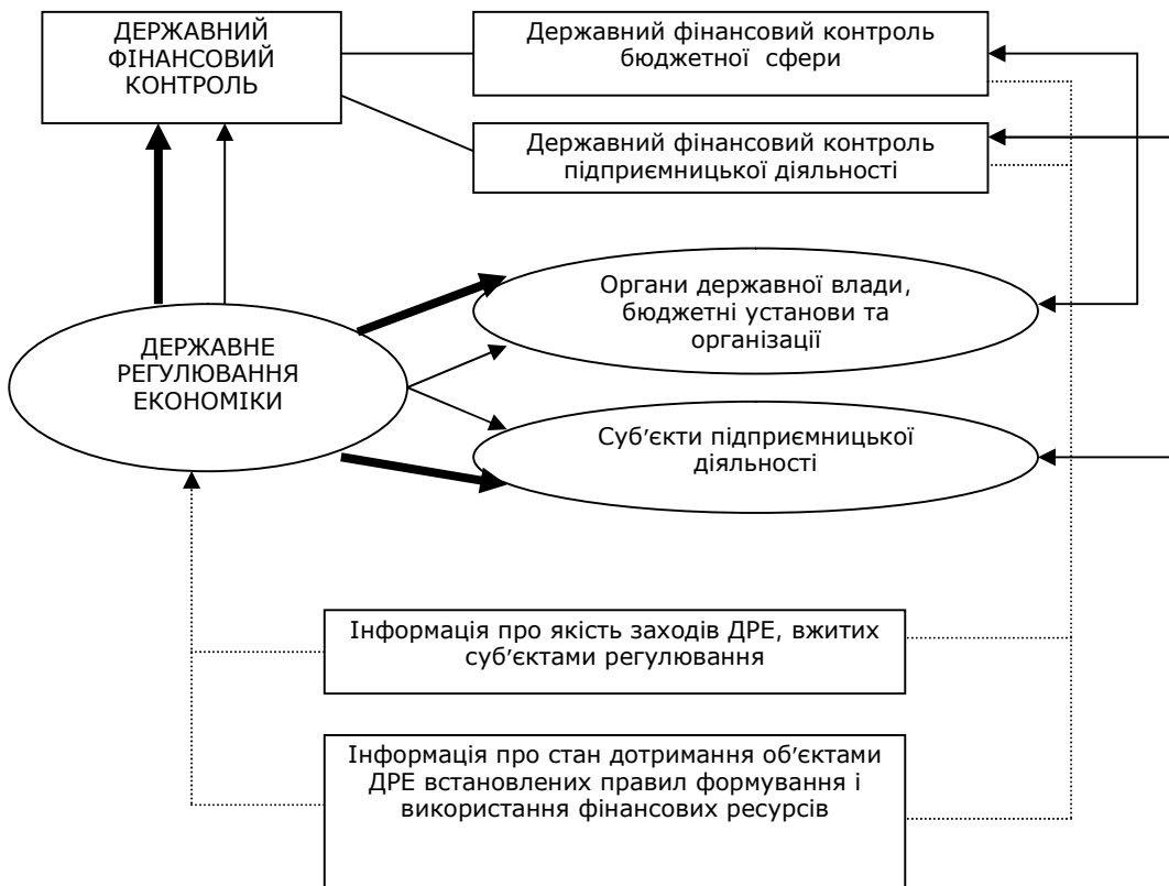
Рис. 1. Місце державного фінансового контролю в системі державного регулювання економіки [2]

Звідси роль державного фінансового контролю в системі державного регулювання економіки виражається через участь у розв'язанні двох проблем: 1) підвищення ефективності державного регулювання економіки; 2) дотримання правил формування і використання фінансових ресурсів, встановлених державою (рис. 1).