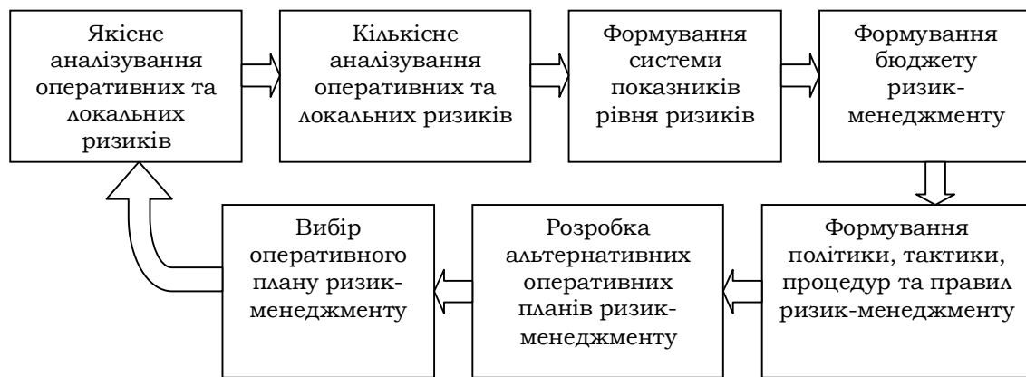
Рис. 2. Модель оперативного планування ризиків у діяльності машинобудівного підприємства

Традиційно в плануванні діяльності підприємства заключним етапом є формування плану дій. Окрім цього, при плануванні ризиків необхідно створювати каталоги ризиків, які притаманні машинобудівному комплексу та діяльності конкретного машинобудівного підприємства (табл. 1).